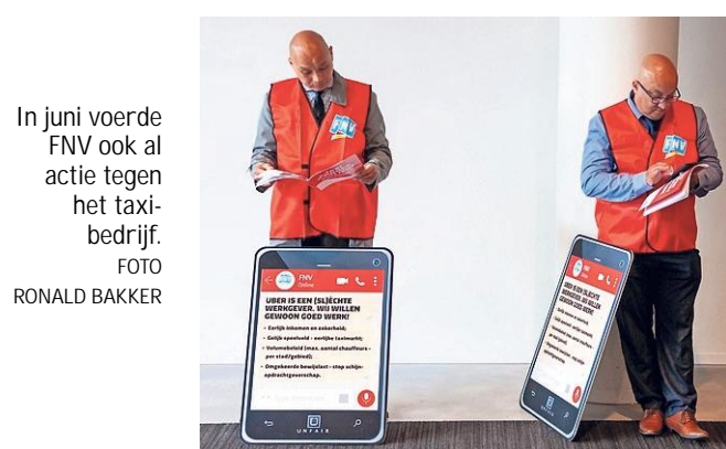
In juni voerde FNV ook al actie tegen het taxi-bedrijf.

Uber heeft in de ogen van Sewgobind alle kenmerken van een werkgever, waardoor er alleen op papier sprake zou zijn van zelfstandig ondernemerschap.