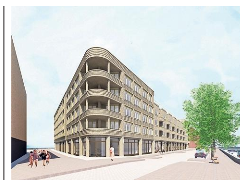
In Lariks, het nieuwe pand in de Houthaven, kunnen jongeren een kamer huren voor circa 250 euro per maand.

Wie de foto's ziet, kan niet anders concluderen dan dat ze ook geschikt zijn om te exposeren. Dat gebeurt volgende maand in Hotel Arena in Oost.